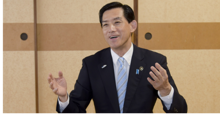
まつざき こうじ ■昭和 33 年小浜生まれ。県教職員として務めた後、県教育研究所、若狭教育事務所勤務。平成 7 年県議会議員選挙初当選。4 期 13 年務める。平成 20 年に小浜市長選に立候補し、当選。2 期 8 年を務める。生玉区在住。

大規模災害が発生した場合には、行政機関による「公助」だけでなく、「自助」「共助」が大変重要になり、地域の自主防災組織の存在と活動が必要不可欠です。自主防災組織の立ち上げや、防災活動への財政的支援などによる組織の育成を推進し、市民の皆様の安全・安心な暮らしの充実に努めていきます。 本市には、主要道路が東西南北に整備されています。しかし、歩道の未整備区間や、路線改良の必要な箇所、橋梁の架け替えが必要な箇所などがあります。重要な生活道路であるとともに、広域避難計画の避難ルートでもある道路の整備・改良を、引き続き国、県に対して要望していきたく考えています。 老朽化が著しい健康管理センターのリニューアルも喫緊の課題となっています。保健・福祉サービスの強化・拡充を目指し、リニューアル後は、乳幼