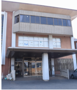
老朽化が進む健康管理センター

大規模災害が発生した場合には、行政機関による「公助」だけでなく、「自助」「共助」が大変重要になり、地域の自主防災組織の存在と活動が必要不可欠です。自主防災組織の立ち上げや、防災活動への財政的支援などによる組織の育成を推進し、市民の皆様の安全・安心な暮らしの充実に努めていきます。 本市には、主要道路が東西南北に整備されています。しかし、歩道の未整備区間や、路線改良の必要な箇所、橋梁の架け替えが必要な箇所などがあります。重要な生活道路であるとともに、広域避難計画の避難ルートでもある道路の整備・改良を、引き続き国、県に対して要望していきたく考えています。 老朽化が著しい健康管理センターのリニューアルも喫緊の課題となっています。保健・福祉サービスの強化・拡充を目指し、リニューアル後は、乳幼