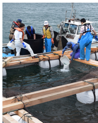
サバの養殖を6月からスタート

水産振興の面では、本年度より、市内の水産研究・人材育成機関と連携して、「マサバ」の養殖を開始しました。養殖サバは、10月開催の鯖サミットでお披露目するとともに、日本遺産のストーリーを生かした、高付加価値販売を目指しています。