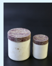
化粧品などのビン