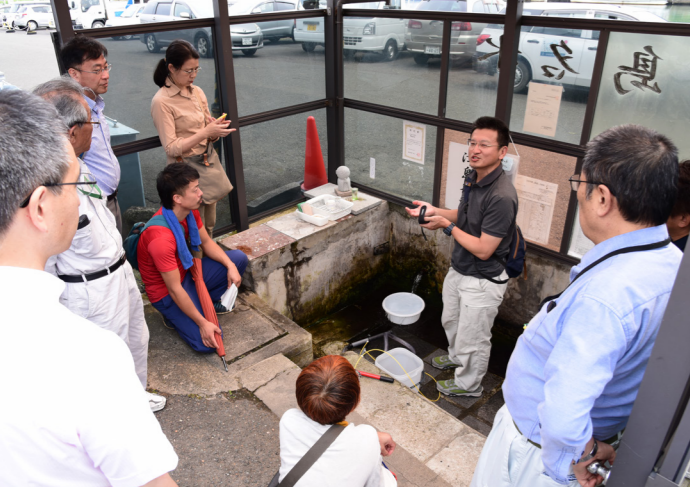
7月25日（日）に、地下水利活用・保全検討委員会による現地視察が行われました。委員や市・県の関係者ら約20人が、市内12カ所の掘抜き井戸や水源を見て回り、地域住民らから聞き取りを行いました（写真は津島名水）

調査の結果を受けて、市民や専門家などの委員21人による、地下水利活用・保全検討委員会を立ち上げ、7月8日（金）に初会合を開催しました。地下水を保全しながら、まちづくりりに生かすことを目指すもので、平成30年度中に基本方針を取りまとめる予定です。