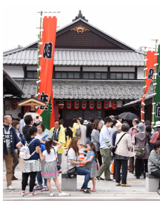
5月にオープンしたまちの駅・旭座

5月1日にオープンしました「まちの駅」につきましては、道の駅、海の駅との、3駅連携による回遊性などにぎわいの創出を目指しています。まちの駅の拠点施設である「旭座」は、全国的にも希少な明治期の芝居小屋となっています。「活用する文化財」として、旭座の価値・魅力をさらに発信し、市民と観光客との交流が生まれる場所になるよう、盛り上げを図っていきます。