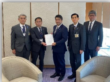
▲木原内閣官房副長官に提出