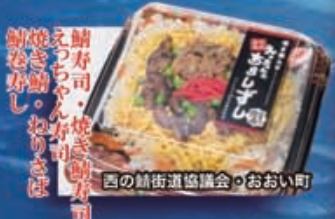
西の鯖街道協議会・おおい町