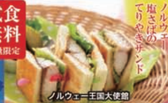
ノルウェー王国大使館