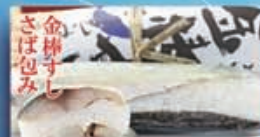
新見の里&Café 曹寿司一本店 (岡山県新見市)