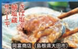
同富商店 (鳥根県大田市)