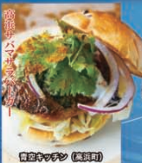
曹空キッチン (高浜町)