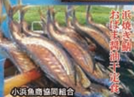
小浜魚商協同組合