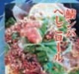
若狭 OBAMA モノづくり合衆国