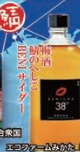
エコファームみかた (若狭町)