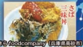
あきらfoodcompany (兵庫県高砂市)