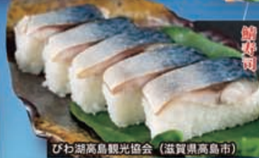
びわ湖高島観光協会 (滋賀県高島市)