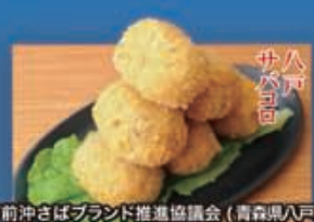
八戸前沖さばブランド推進協議会 (青森県八戸市)