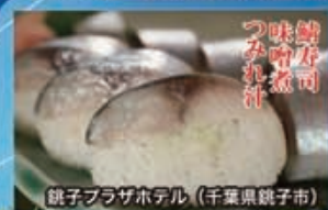
鯖子ブラザボテル (千葉県銚子市)