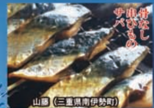
山藤 (三重県南伊勢町)