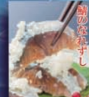
たからす我袖倶楽部 (小浜市)