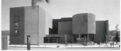
御食国若狭おばま食文化館