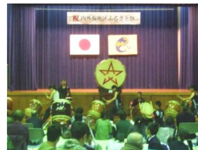
阿納尻区/勇粋連 「名田庄太鼓」