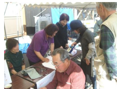
若狭ハイツさんも協力 ふれあいサロン