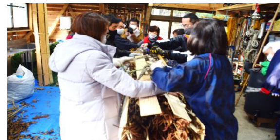
2/7(日)神宮寺で作り方を教わる保護者の皆さん。