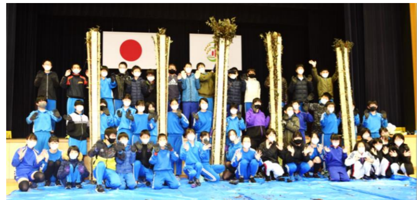
たいまつ完成！笑顔でばんざーい！卒業前の良い思い出になりました♪

遠敷が誇る伝統行事「お水送り」を伝えるために毎年開催される「たいまつ作り」。3月2日の本番に向けて五本の中たいまつを完成させました。