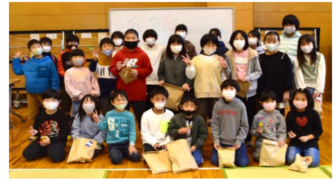
遠敷の子どもたちは元気いっぱい！ 来年も笑顔で過ごそうね！