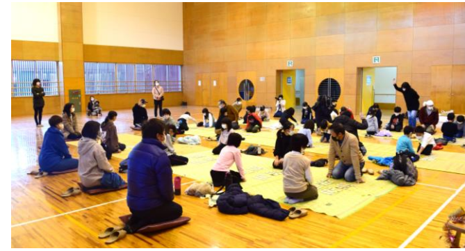
先生からかるたの指導を受けています

「日本の伝統文化・百人一首かるたを子どもたちに知ってもらおう！」 かるたを知らない子には講師の先生が 一から丁寧に指導。知ってる子どもたちは 各々試合に挑み、25名の子どもたちが 楽しいひとときを過ごしました。