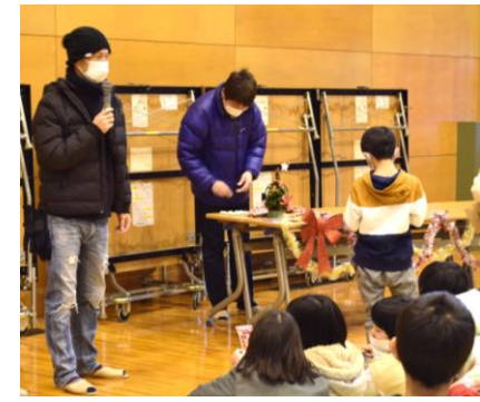
最後はお楽しみビンゴ大会♪