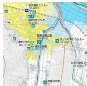
小浜市のハザードマップより遠敷地域を抜粋

・避難所が過密になることに備え、自宅、車中泊、親戚・知人宅、ホテルへの避難の検討も。車中泊の場合、食事や飲料水を受け取る為に最寄の避難所の確認やエコノミークラス症候群・熱中症対策も重要です。