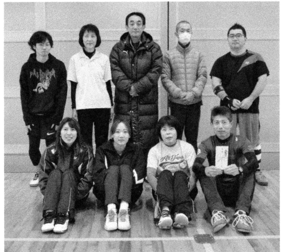
日頃から毎週地道に練習を重ねて来た遠敷チーム。見事な二連覇おめでとうございます!

★大会結果★ 第1位-遠敷地区 第2位-口名田地区 第3位-西津地区 〃 -中名田地区