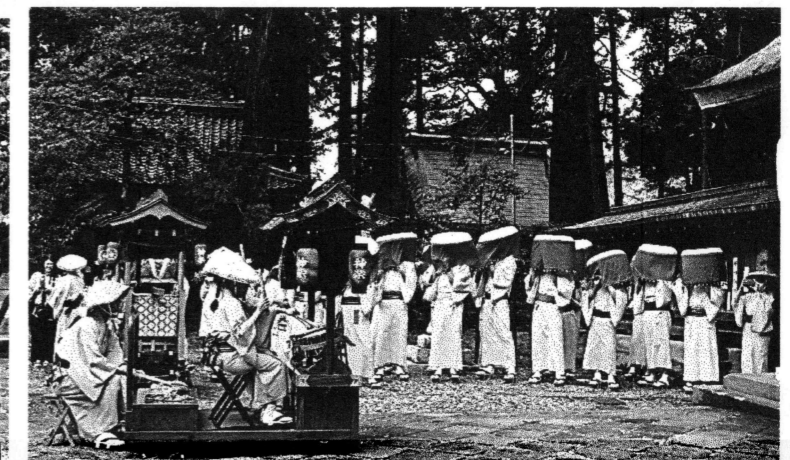
心配されていたお天気も持ち直し、「五穀豊穡」に感謝の意を含め、奉納巡行が無事執り行われました。