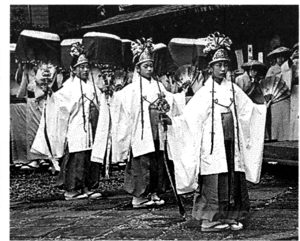
厳かに・・・神楽に合わせ「稚児舞」も奉納