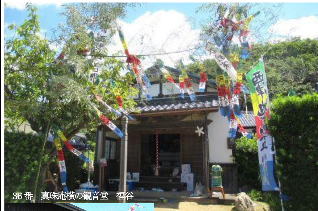
36番 真珠庵横の観音堂 福谷

八月二十三日 孟蘭盆の風物詩 西津の地藏盆 この「五色旗」の色は「仏旗」からきており、空・風・火・水・地という、意味を持ち、宇宙の力で子どもたちを守ってくれるといわれています。