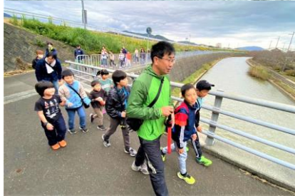
子ども達も大勢参加してくれました♪