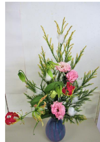
雪冠杉、グロリオーサ、トルコキキョウ / MOA 山月生花スクール

師走の作品と句 いさぎよく 秋を紅葉の もえさかり たちまちに入る 灰色の冬 岡田 茂吉 詠