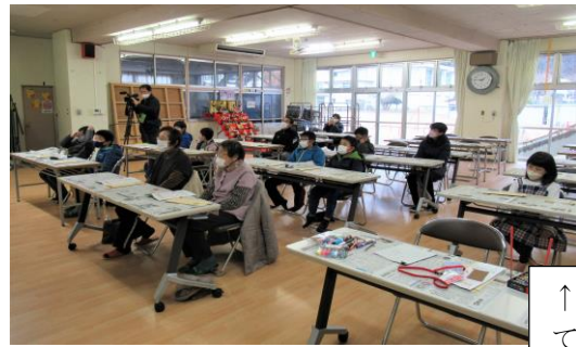
↑こちらはアイデア箸。さでどんなアイデアでしょう