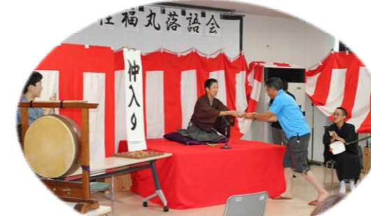
飛び入りで拍子木をたたくお客さん「うまい!」とお褒めの言葉をいただく