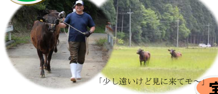
「少し遠いけど見に来てモ〜」

今年は2頭の牛が5月18日(木)に中名田に仲間入りしました。小屋区の放牧地を(一社)中名田のみなさんが草刈りや電柵の準備をしてくださり、万全な体制でお迎えすることができました。2頭とも妊娠中のママさん牛、「耳標」No.167「わかふく3」、No.168「わかつぎこ1」。誕生日が5日しか変わらない同級牛(?)仲良く牧草を食べ、美味しい水を飲み元気に妊牛ライフを過ごしてもらいたいです。11月頃、嶺南牧場に帰り出産準備に入るそうです。