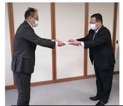
1/24(火) 認定式がありました