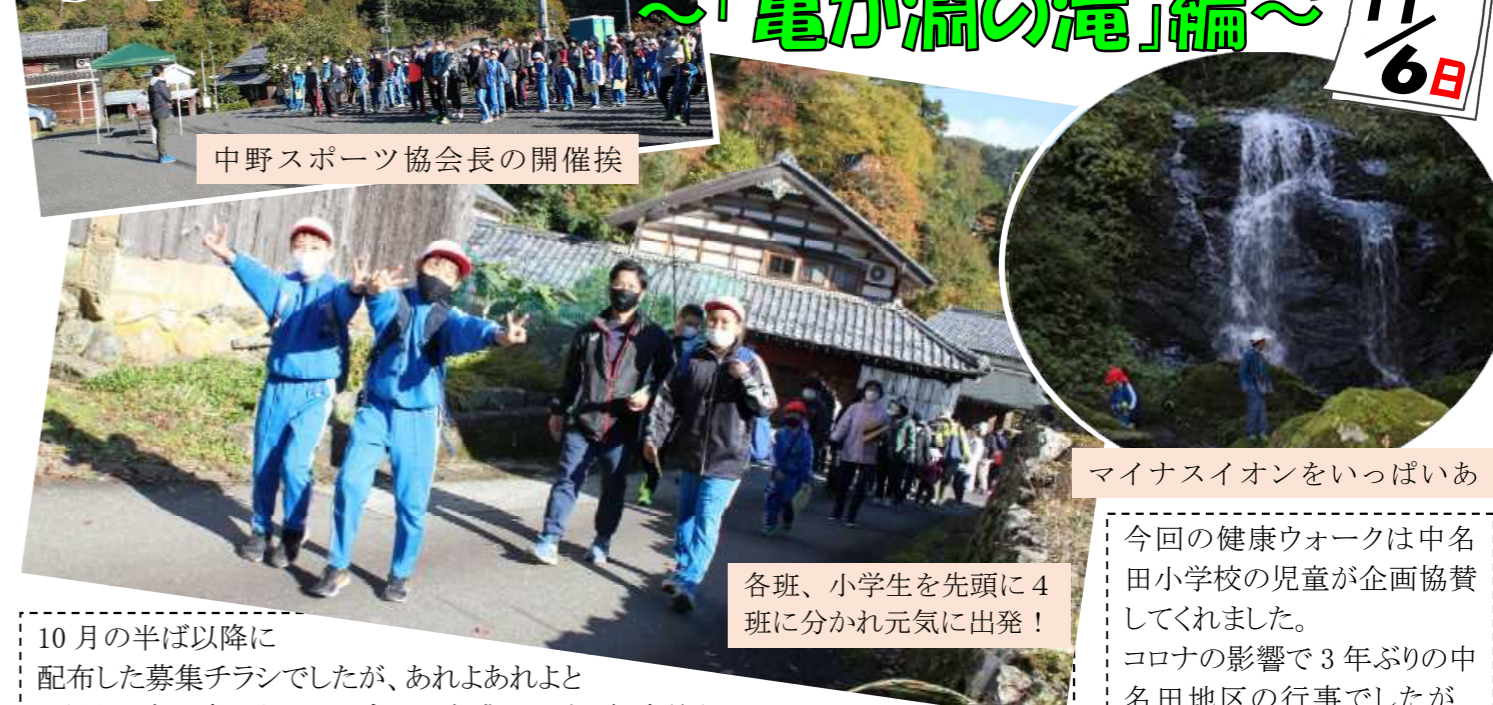
中野スポーツ協会長の開催挨拶