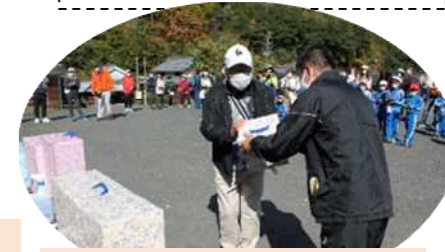
多くの方が賞品ゲットしま