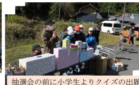
抽選会の前に小学生よりクイズの出題 賞品には小学生が育てた「いちほまれ」