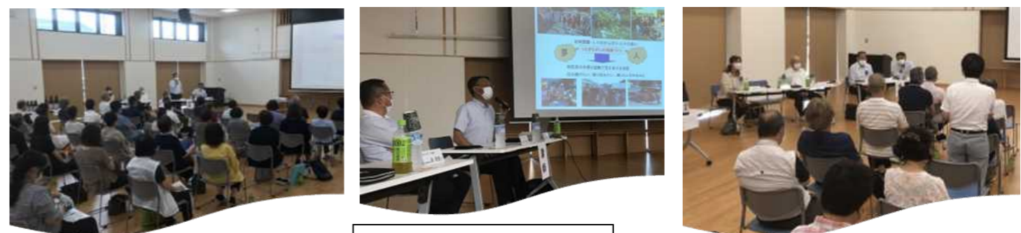
越前市花籠地区での様子

また、二つの地区の方々には、地酒「田村のめぐみ」の購入についてもご協力いただきました。