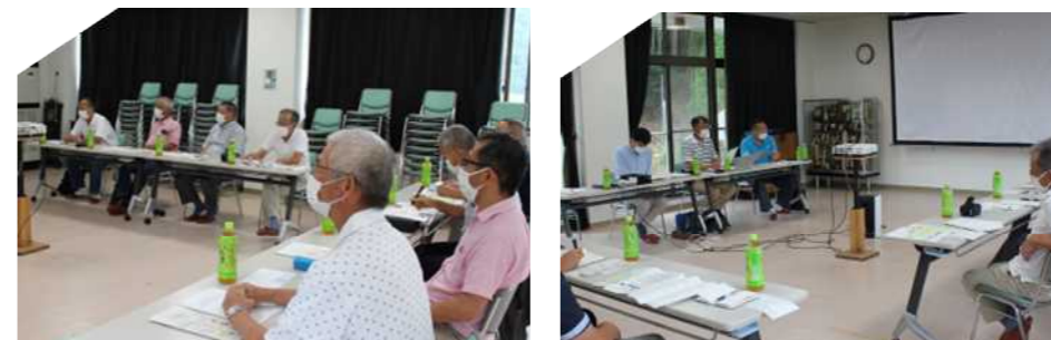
西脇市芳田地区 区長様との交換会