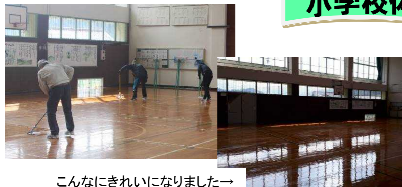
こんなにきれいになりましたー

中名田小学校の体育館にワックスを掛けました。今年はスポーツ協会さんに協力していただき、声を掛け合いながら作業を進めていきました。ちょうど一週間後に卒業式を控えていたのでピカピカの床で気持ちよく送り出せるよう一生懸命頑張りました。一時間ほどで作業は終了し、やりきった感で帰路に着きました。協力して下さった方々、お疲れ様でした。