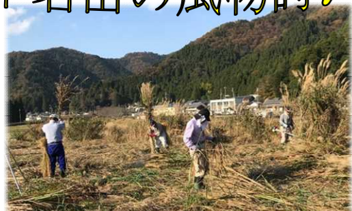
今年は上和多田に沢山の苧が出来ました 雪をかぶるとより幻想的です(産物組合)