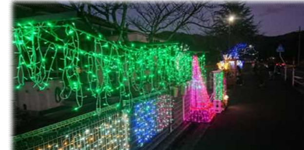
保育園の塀を利用して色鮮やかに スノーマンも登場 R4. 2. 26まで(和多田ボランティア)