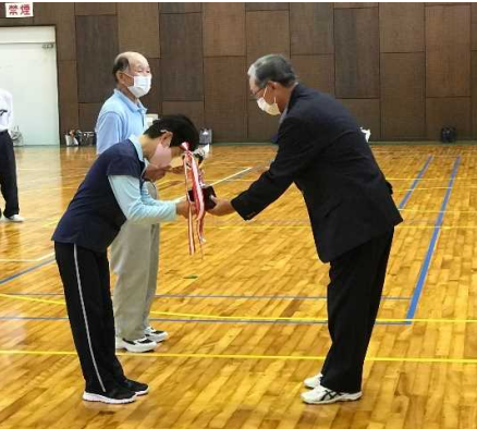
輪投げ大会で表彰を受ける 中名田くらぶ輪チーム