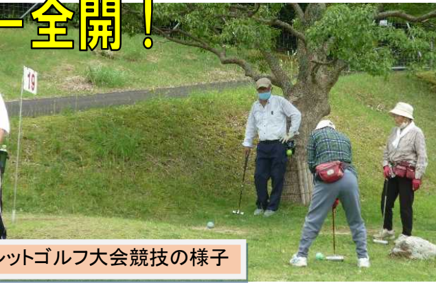
マレットゴルフ大会競技の様子

秋になり、コロナ感染の広がりには落ち着きが見られるようになりました。我々の行動制限も少しずつ緩和に向かっています。老人会の行事も行われるようになりました。そんな中、中名田老人クラブの活躍に目を見張るものがあり、様々な大会で素晴らしい成績を残しておられるのでご紹介します。主な成績を紹介します。（敬称略）