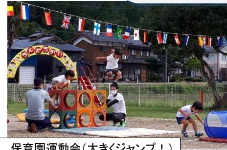
保育園運動会(大きジャンプ！)