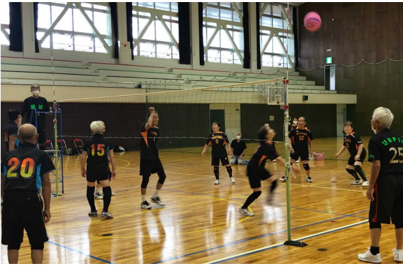
ソフトバレー大会の様子