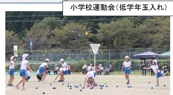
小学校運動会(低学年玉入れ)