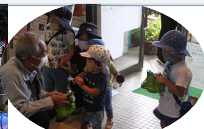
保育園遠足(ハッピーハロウィン)