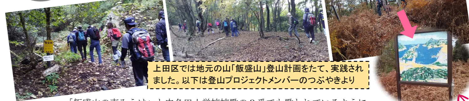
上田区では地元の山「飯盛山」登山計画をたて、実践されました。以下は登山プロジェクトメンバーのつぶやきより

「飯盛山の恵みうけ」と中名田小学校校歌の3番でも歌われているように、飯盛山は中名田が誇る名山です。そんな飯盛山ですが、私はというと小学校の遠足で登って以来、約30年近く登っておらず登山道さえ覚えていません。子どもにいたっては、他の山を飯盛山と勘違いしている始末です。飯盛山のある上田区民がこんなではいけないと思い、飯盛山登山を計画し11月8日(日)に登ってきました。