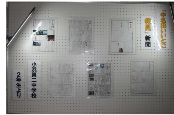
センターからいただいたパネル