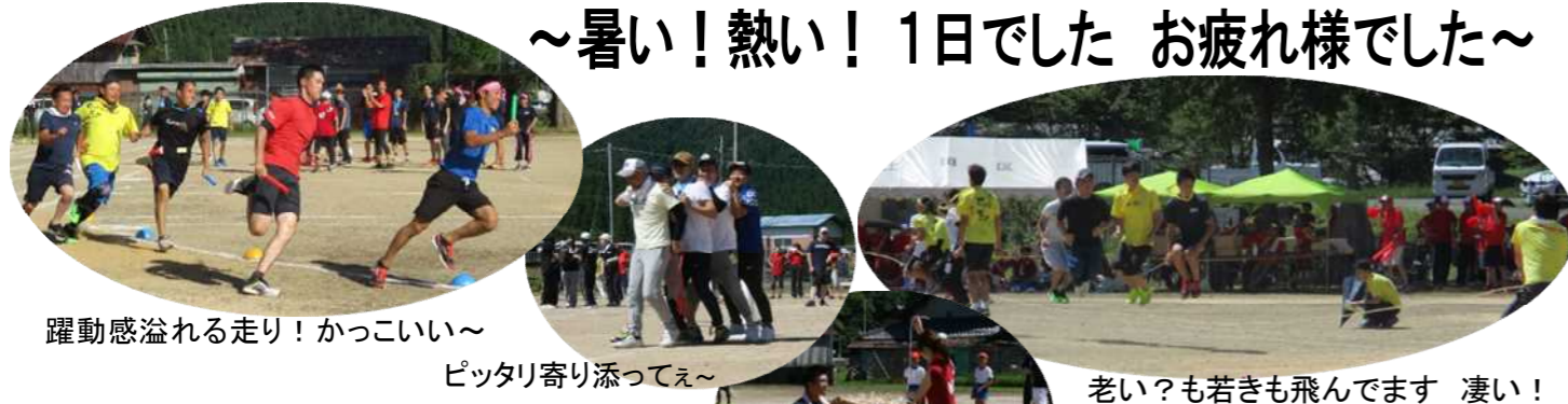
躍動感溢れる走り！ かつこいい～