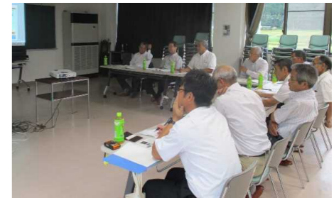
お礼状をいただき恐縮した次第です。

昨年度から視察訪問を受けることが多くなっています。8月30日(金)兵庫県西脇市から10名の方が来館されました。高齢化や人口減少による自治機能の低下、活動を進めていく上でのメンバーの確保など、お互いが共通する課題について情報交換をしました。また市や国からの交付金の使い道やスマイルカーについての質問もあり、中名田の実情を説明しました。後日、西脇市長様から