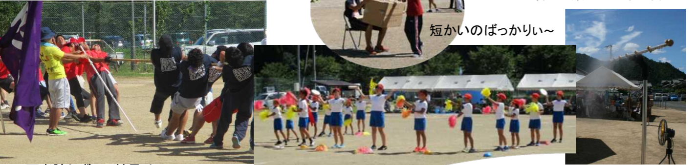
短かいのばっかりい～