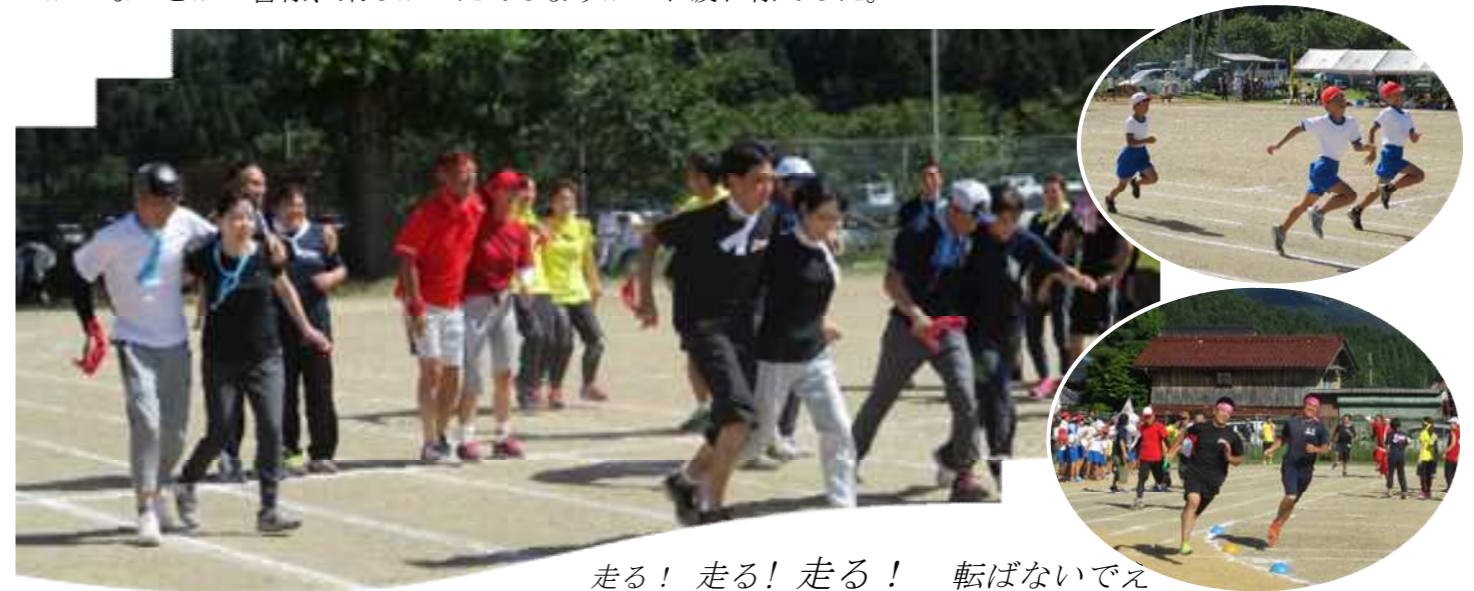
走る！走る！走る！ 転ばないでえ

晴天に恵まれた9月8日の日曜日、区民の皆さんが待ち望んだ体育祭が開催されました。今年は体育祭日和で去年開催できなかった分まで白熱した競技が続きました。活気溢れる各区の熱気が気温を上昇させ熱中症にならないか心配しましたが、皆さん事前対策をしっかりとこなっており大事にならずにすみました。小学校のスローガンに「最後に笑える体育祭に」とあり小学生が競技の後に見せる笑顔がキラキラと輝いていて見ているこちらにも笑顔になりました。今年も無事に終り来年に向けて動きだしてる区もあるのか？ないとか？皆様、楽しかったでしょうか？お疲れ様でした。