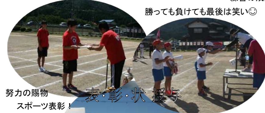
努力の賜物 スポーツ表彰！