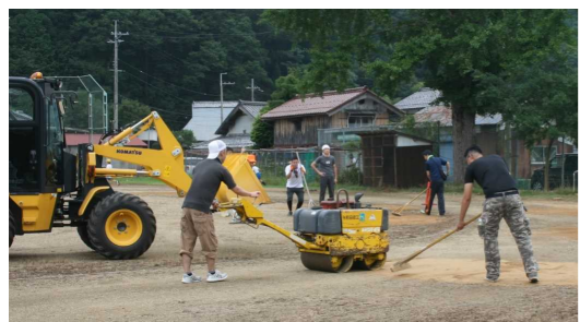
綺麗にさせていただき有難うございました。

ここにこ体育祭一週間前の9月1日(日)、グラウンド整備を行いました。今年は草むしりではなく、土の補充・庭木の剪定などの作業を約2時間、区長会・スポーツ協会・ゆめづくり協議会を中心に約40名が作業しました。