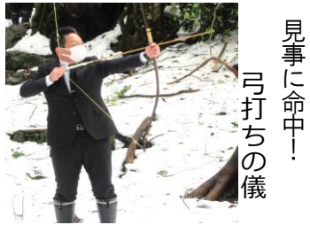
見事に命中！ 弓打ちの儀