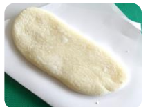
神事終了後に 配られた御供餅 「牛の舌」