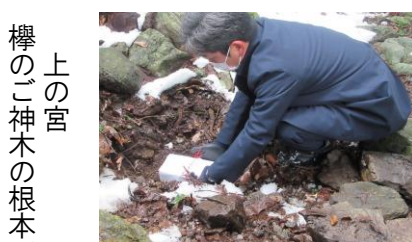
新埋納箱埋納の儀