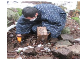
旧埋納箱取起しの儀