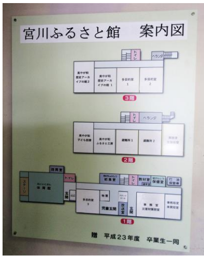
既存の館内案内板を修正活用