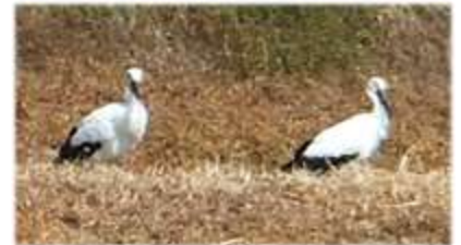
↑ 大谷区でコウノトリに偶然遭遇