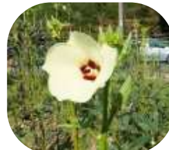
↑ オクラの花 大谷区