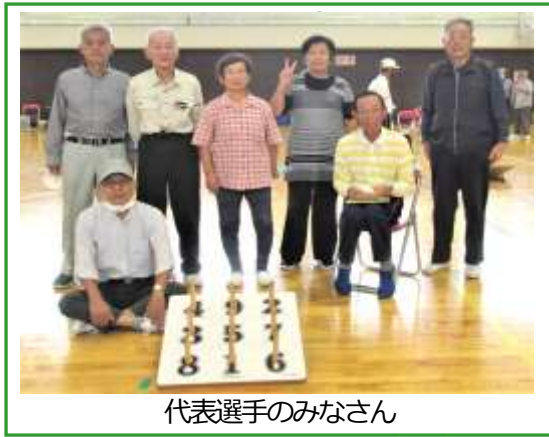
代表選手のみなさん