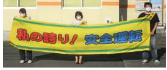
加茂・大戸区 宮川郵便局前