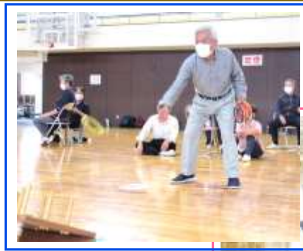
全集中で臨んだ 試合の1コマ