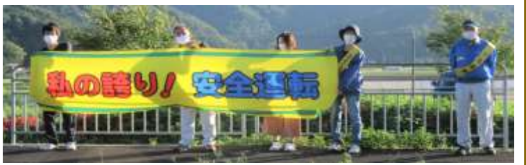
新保・竹長区 新保橋 通学児童に交通安全指導。