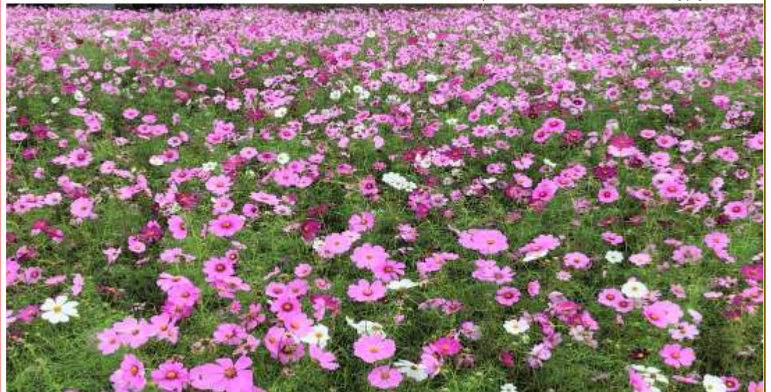
↓ アイザワ商店前の休耕地に咲く コスモス R3.10.13