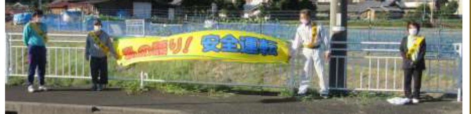
本保・大谷区 大谷橋