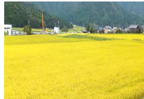
本保区において R3.9.7 撮影

に秋を感じます。トンボが飛び交う地区内の黄金田では稲刈り作業が続いています。ハナエチゼンの後はコシヒカリ。美味しい新米を食べてコ罗纳を吹き飛ばしましょう！