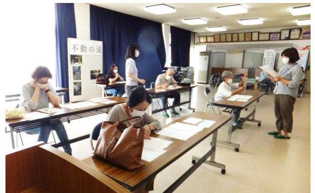
感染対策も万全に!少人数ずつ申請手続きをしました