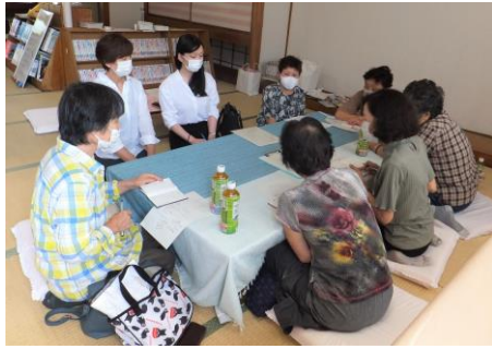
ボランティア会議の様子