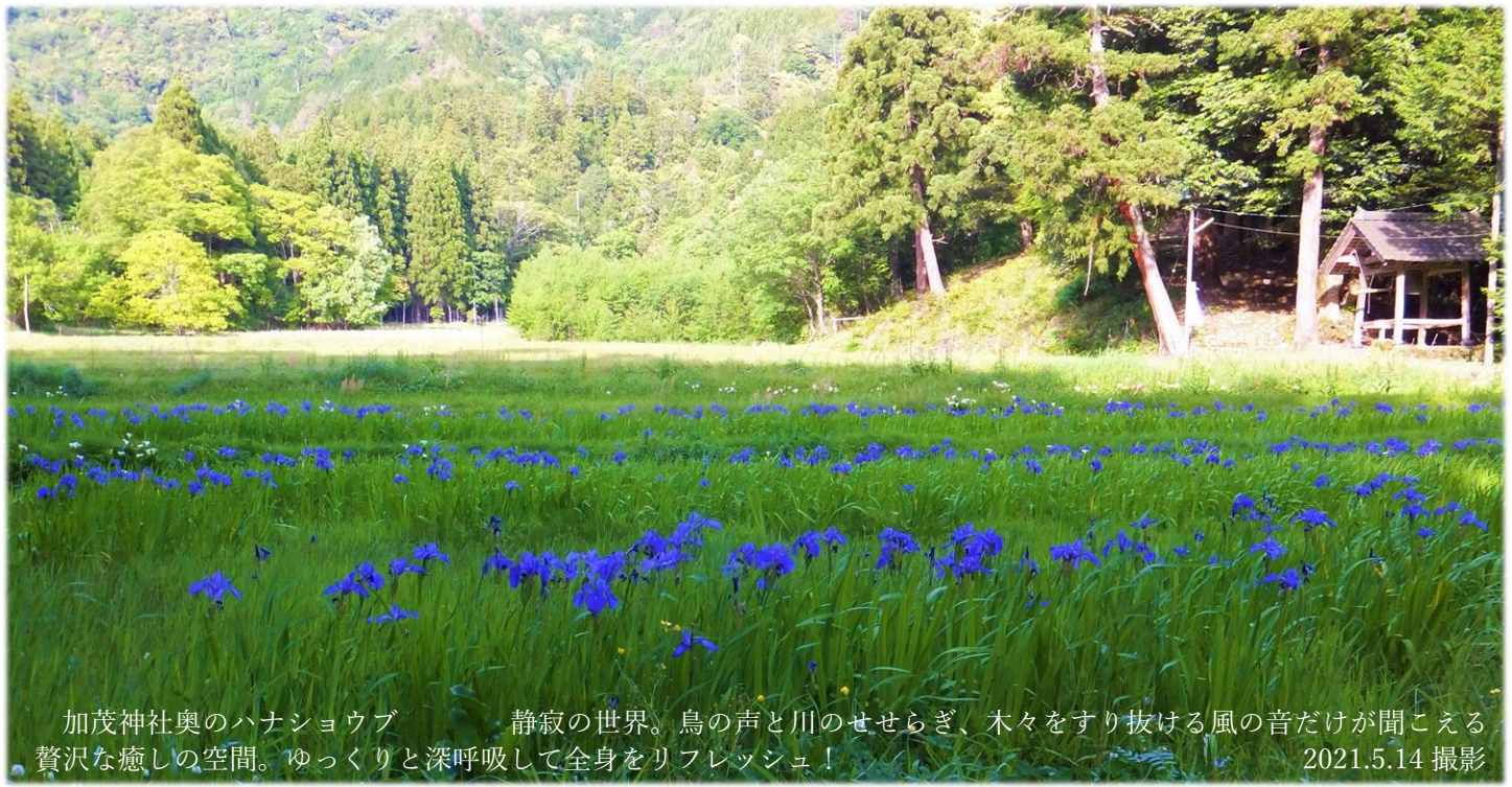
加茂神社奥のハナショウブ 静寂の世界。鳥の声と川のせせらぎ、木々をすり抜ける風の音だけが聞こえる 贅沢な癒しの空間。ゆっくりと深呼吸して全身をリフレッシュ！ 2021.5.14 撮影