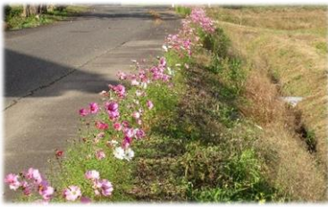
◀竹長区の道沿いに咲くコスモス。背丈が低くてかわいいです。