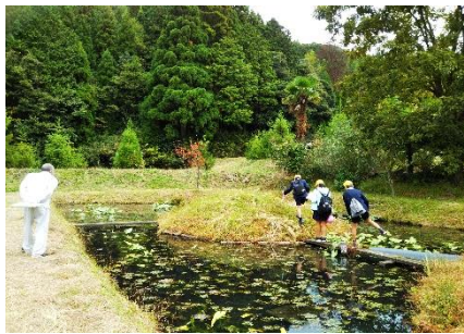
▲ビオトープの中島を渡る児童たち

この日、4~5人ずつに分かれた2班が宮川地区を訪れ、1班はコミュニティーカーに乗って宮川周遊コースを、もう一班は加茂神社からビオトープを通って加茂古墳を探索しました。