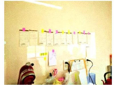
厨房に貼られる予約受注票。1週間前までに予約すれば、記念日などに用いホールケーキの販売もしている(定休日以外)。

ばいで余裕がないのですが、もう少し落ち着いたら、少しずつ新商品の開発をしたいと考えています。せっかく地元で出店しているの、お花を使ったスイーツを作って「花の里みやがわ」をPRできたらなと思います。宮川で採れるトマトや、地元の方が作る果物や農作物も使いたいです。私自身、結婚して宮川地区にやって来るまで宮川地区がどういふ所か知りませんでした。このお店が、宮川地区の素晴らしさを知ってもらえきっかけになれば、こんなに嬉しいことはありません。