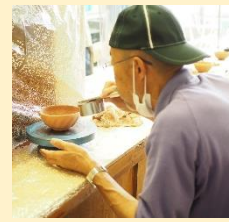
吹き付け(釉薬付け)