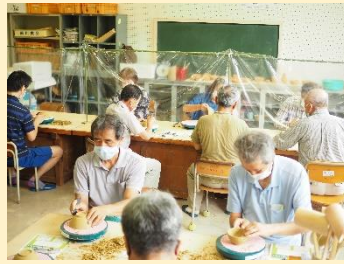
飛沫感染防止に衝立設置