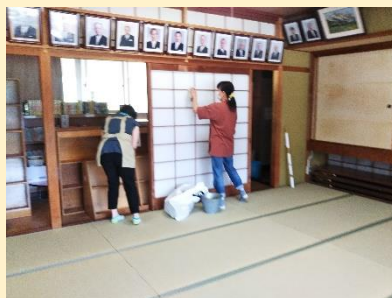
図書室の片付け・掃除