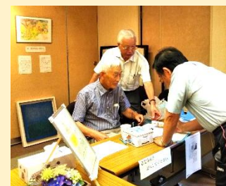
宮川の歴史を伝える会のみなさんも当番制で御在廊。