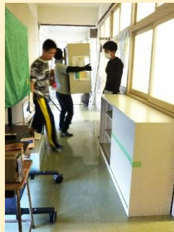
廊下に出したままの備品を必要な部屋へ移動させる