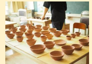
釉薬を付けた後の作品