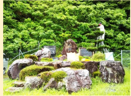
土地改良記念碑周り