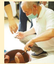
どぶづけ(釉薬付け)