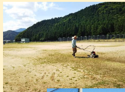
自走式草刈り機も 出動しました