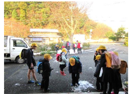
▲公民館前でバスを待つ児童たち(昨年度)