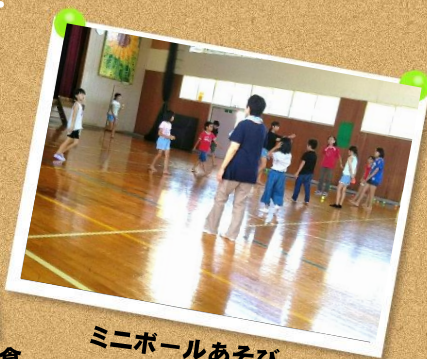
ミニボールあそび