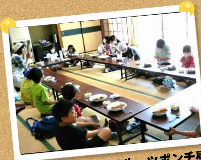
カレー&フルーツポンチ昼食