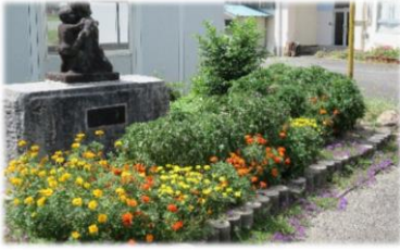
◀旧宮川小学校花壇は、綺麗に咲いています。