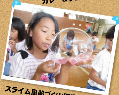
スライム風船づくり(児童館)