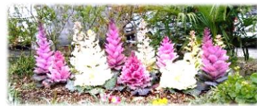
館長が種から蒔いて育てた葉ボタン