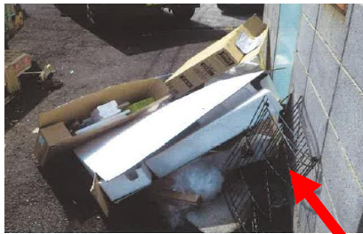
スチールフェンス