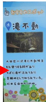
中心看板の両側には、大谷区の滝不動と加茂区の加茂北古墳の特集看板が添え付けられています。