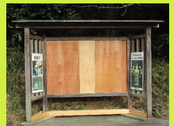
背板と足場も直しました。