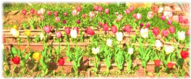
館長特製チューリップ花壇