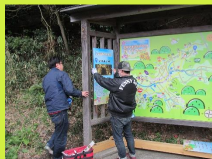
観光拠点部会が中心となって設置しました。