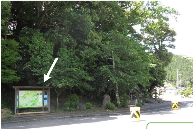
ちょうど宮川地区への入り口に当たります。

昨年度総務省からの助成をもらって「まほろばの里 若狭みやがわ創生事業」が始まりました。その事業によって宮川地区内にどんな変化があったのか、少しずつ紹介していきます。