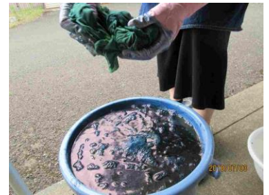
▲藍の染料に浸して絞る

「藍染はよく聞くけれど、あのコウギクで染物とな！？ これは、取材に行かねば…。」