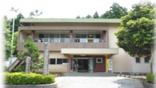
加斗コミュニティセンター