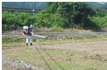
▲線路横の畑にコスモスの種まき(8/19)