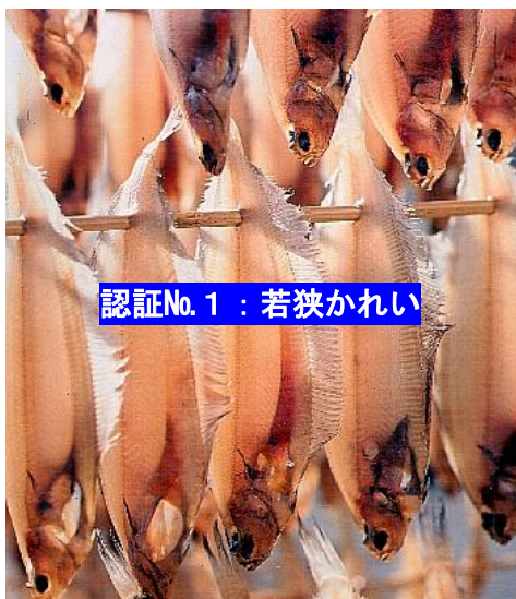
認証No. 1 : 若狭かれい