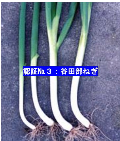
認証No. 3 : 谷田部ねぎ