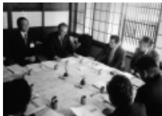
古い建物を保護し、まちづくりに活かしている秩父市