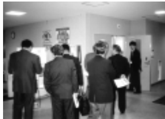
産学官が連携して新産業の振興、発展に取り組むため設置された産学官連携支援施設