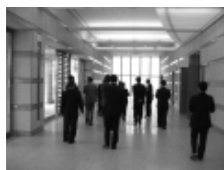
火葬場のイメージとは離れた近代的な「いずみ霊園」