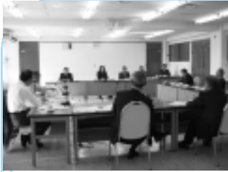
柔軟かつ先進的な議会運営を行う小金井市議会

世界遺産ブランドと衰退した都市との実態の中における都市再生に向けた議会の役割とその運営について