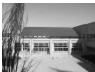
ソーラー発電、雨水再利用システムを導入した来住小学校