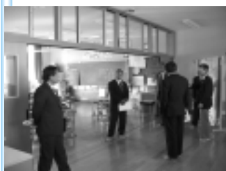
教室と廊下の壁を可動式にし、スペースを有効に活用