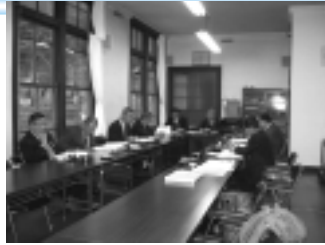
議会と行政が一体となって日光ブランド再生に取り組む日光市議会