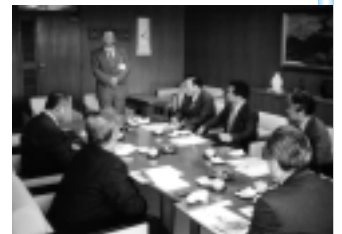
ロケ地として積極的に誘致を展開し、市の活性化に取り組む上田市

民生文教常任委員会は、所管事項の調査等の目的により管外の行政視察を実施いたしました。