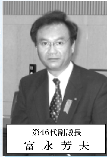
第46代副議長 富永 芳夫

市が掲げています「食のまちづくり」は、市の活性化の基盤づくりとして最も重要な基本政策でもあります。そのためにも今年の「若狭路博2003」は全市民あげて必ず成功させ、ポスト若狭路博に確実につながらなければなりません。