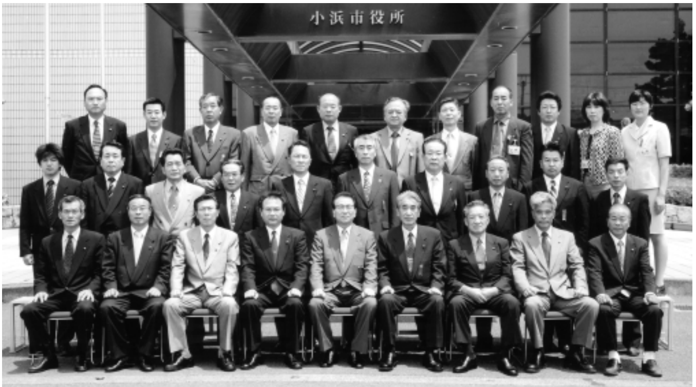
第十四期小浜市議会議員と市四役