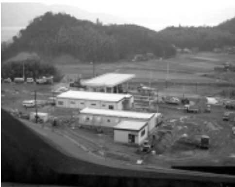
『舞鶴若狭自動車道小浜西IC』