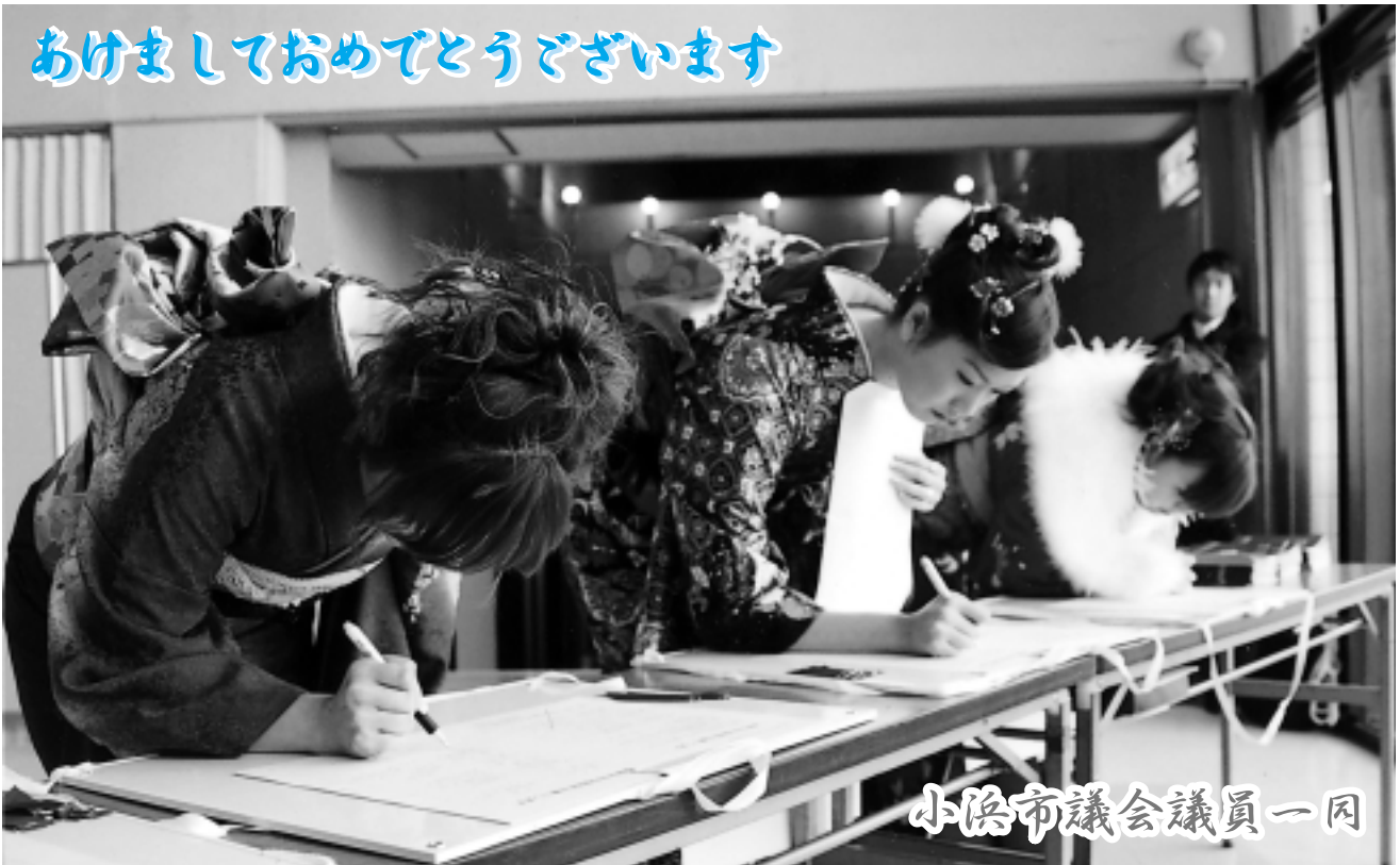
小浜市議会議員一団