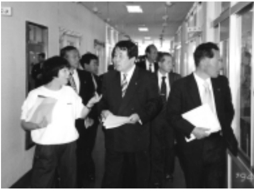
小浜幼稚園視察風景 (民生文教委員会)

《民生文教常任委員会》 市庁舎において、政策懇談会を開催し、小浜小学校の移転建設問題等、所管部門の問題点、懸案事項等について意見交換を行った。