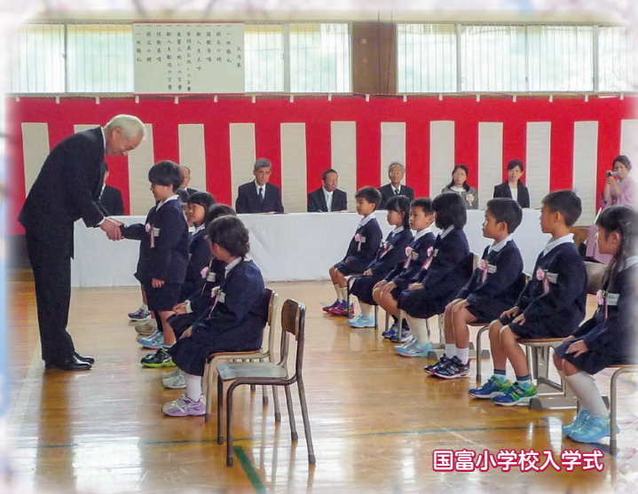
国富小学校入学式