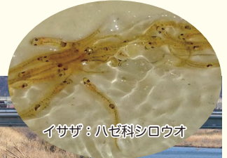
イサザ：ハゼ科シロウオ

漁獲量が激減して高級魚となってしまった今では、なかなか庶民の口には“高嶺の花”ですが、春の訪れを感じる小浜の食文化として、イサザは時代を受け継ぐ“最高のおもてなし”かもしれませんね。