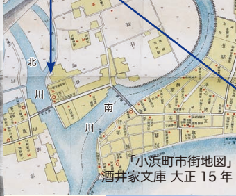
イサザ漁の景色の今昔 小浜聖ルカ教会前 河川改修で北川から南川となる