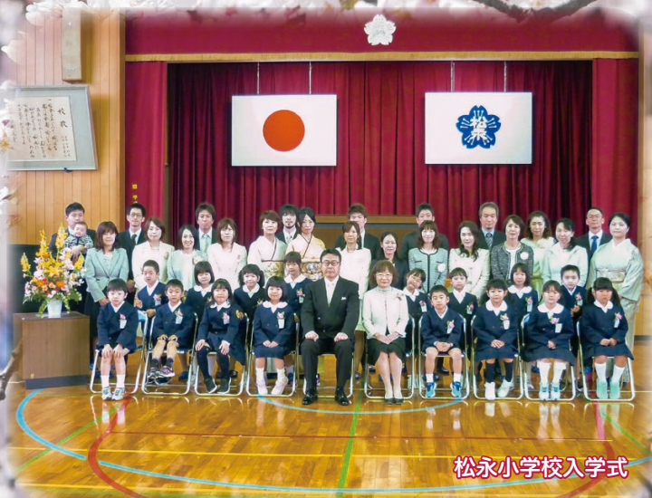
松永小学校入学式

3月定例会の概要 ..... P2 平成30年度当初予算を可決 ..... P4 市政を問う！一般質問 ..... P8