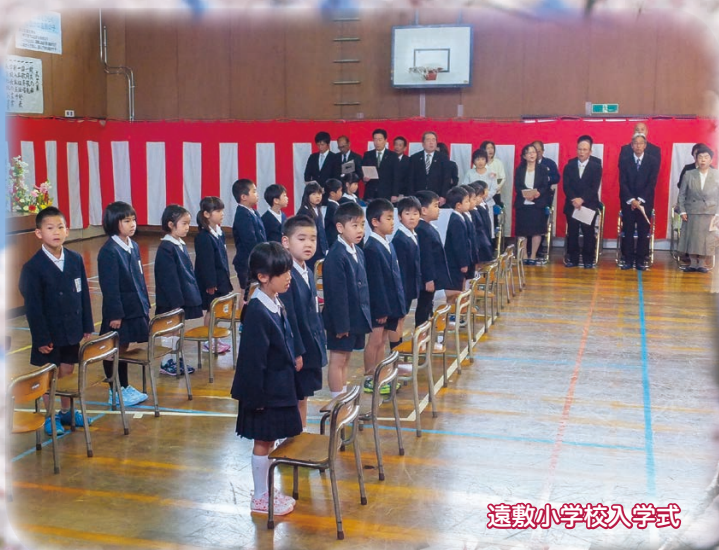
遠敷小学校入学式