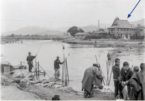
北川 (昭和初期)