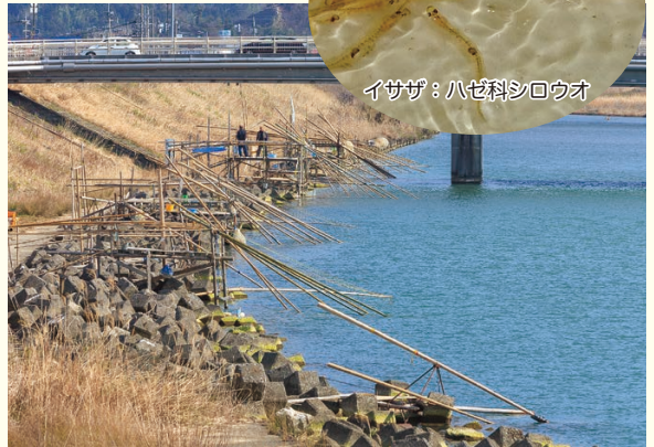
(平成 24 年)