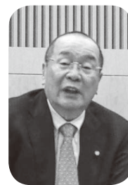
風呂 繁昭 議員

環境づくりを進めていくためには、負担の軽減や経費面の拡充も含めた支援体制の強化が必要不可欠。しっかりとサポートしてほしい。