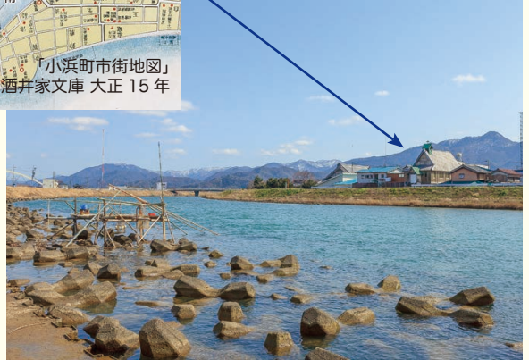
南川 (平成 24 年)

イサザは江戸時代には季節の珍味として食べられており、国学者・伴信友も賞味していた記録があります。