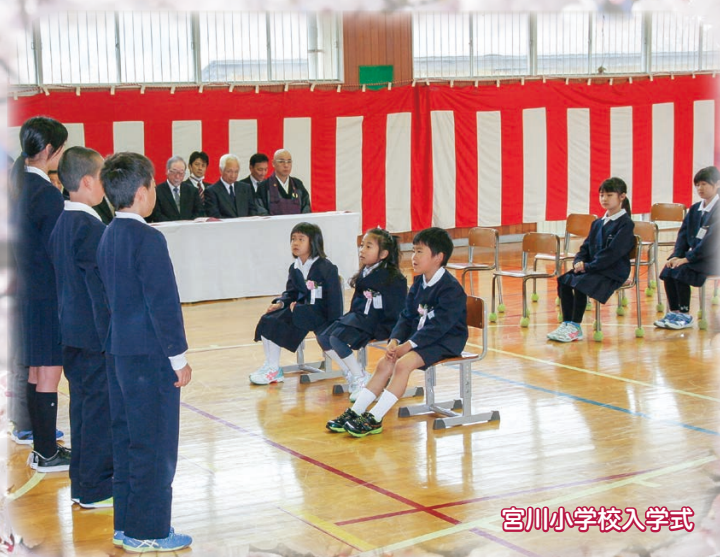
宮川小学校入学式