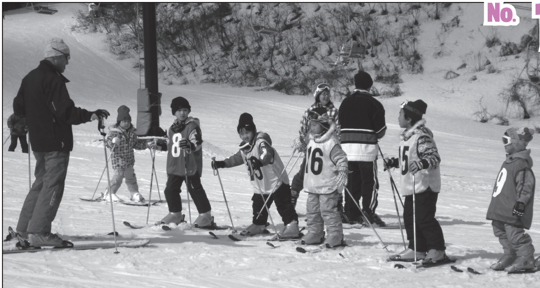
【小浜市スキー連盟の子どもスキー教室】