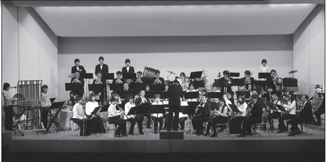
【若狭ウインドアンサンブル定期演奏会】

3月定例会の概要 ○ ○ ○ ○ ○ ○ ○ P2 平成25年度当初予算を可決 ○ ○ P4 議会基本条例施行 ○ ○ ○ ○ ○ ○ ○ P7 市政を問う！一般質問 ○ ○ ○ ○ ○ P8