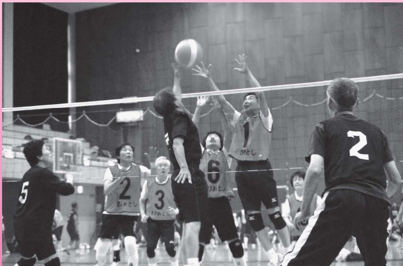
御食国若狭おばま杯ソフトバレーボール大会（市民体育館にて）