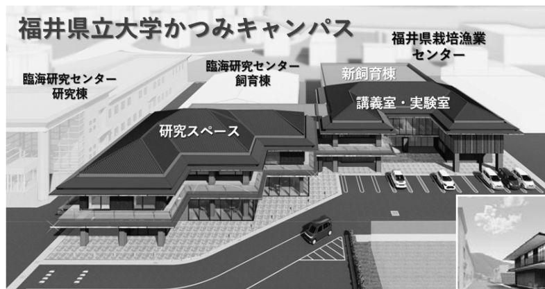
↑ かつみキャンパス 令和5年8月完成予定