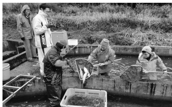
ふくいサーモンの測定風景