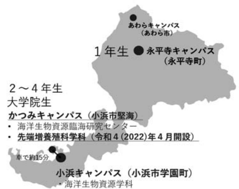
図1. 各キャンパスの位置

かつみキャンパスには本学の海洋生物資源臨海研究センターや福井県栽培漁業センターが隣接し、各機関の相互の連携によ