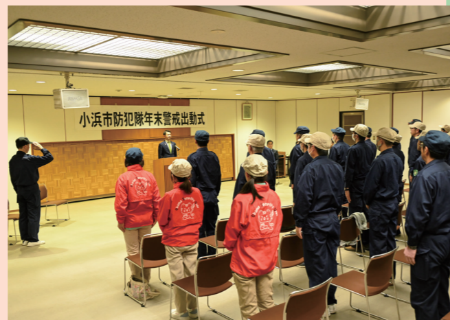
市長に出発を申告 防犯隊年末警戒出動式 小浜市防犯隊全13支隊が一堂に介し市内の犯罪抑止に向けて士気を高める(市庁舎・12月6日)