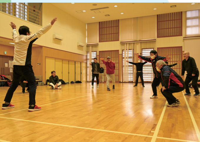
指導に生かす アクティブ・チャイルド・プログラム 子どもに身に付けさせたい動きを指導者が実践で学ぶ(今富コミュニティセンター・12月7日)