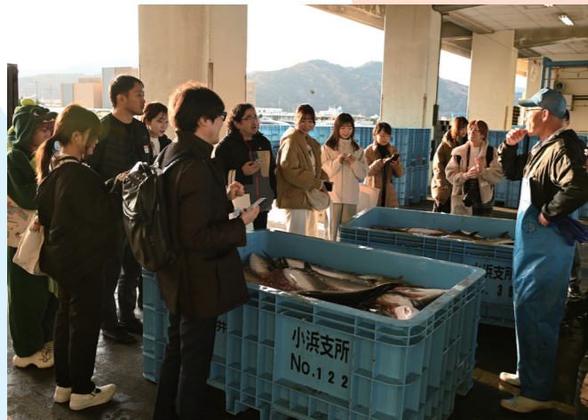
インフルエンサーが巡る“食場体見”ツアー タレントやフォトグラファーなど14人が川崎地区一帯の魅力を市内外に発信(川崎三丁目・12月5日)