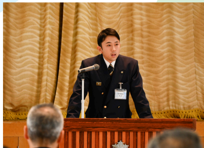
第43回若狭消防組合消防職員意見発表会 若手職員が日頃の業務などを通じて感じた課題に対する意見や提案を熱弁(若狭消防組合消防本部・12月6日)