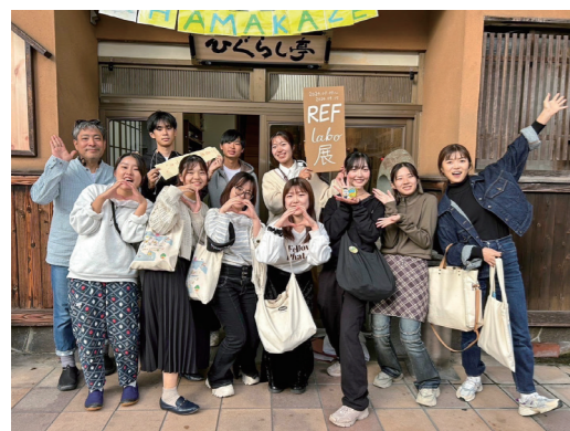
▲小浜 R キャンプで学生と一緒に活動

私は学生するとき、主に関西の学生 が地域の人と協力し、大学で学んだ ことを実践しながら地域課題の解決 に向けたプロジェクトを進める「学 生キャンプ活動」に取り組みました。