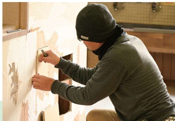
ボランティアで保育園の内装を補修 福井県インテリア事業協同組合わかさ支部の組合員4人が壁クロスの貼り替えなどを実施(宮川保育園・11月30日)