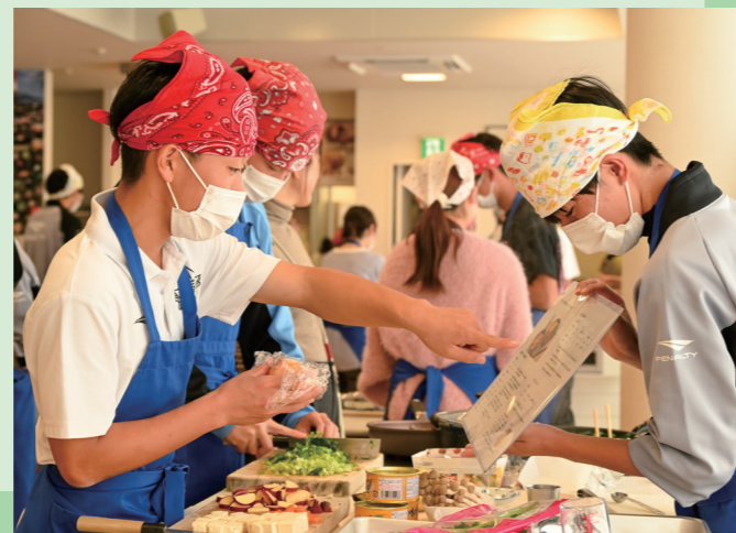
選手のためのパフォーマンスアップ料理教室 若狭高校サッカー部員20人が調理実習を通して「勝つために何を食べるのか」を学ぶ(食文化館・11月17日)