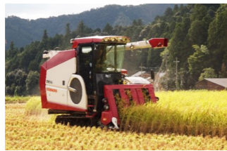
▲生産から加工、販売まで一貫して手掛けることで、作物の付加価値向上につなげる

農地中間管理事業を活用し、個人農家との農地の利用調整や農作業受託などを行っています。