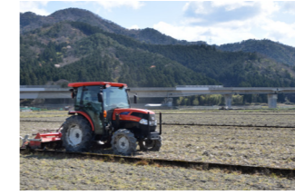
▲トラクターなどの機械の管理を任意組織に委託。耕作は自身や派遣オペレーターが行う

「集落の農地は集落の農家で守る」という意識が高く、将来的には同一作物を栽培する農地の集約（団地化）などに取り組む予定です。