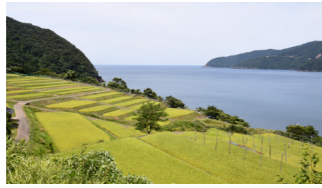
▲風光明媚な景色を生かして、キャンドルイベントなど観光資源としても活用している

同団体は、海に面した風光明媚な「棚田」の維持管理を行っているほか、耕作以外にイベントなども企画し、内外に魅力をPRしています。