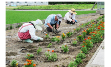
▲個人が所有する幹線道路沿いの農地を利用して、住民らがマリーゴールドを植栽する様子

幹線道路沿いの農地や幹線水路については、地域ぐるみで草刈りや泥上げなどのほか、住民参加による景観植物の植栽などを行っています。