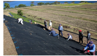
▲環境保全のため、組合員らが法面に防草シートを張る様子