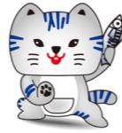
小浜市公認キャラクター さばトラななちゃん