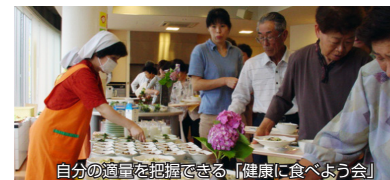
自分の適量を把握できる「健康に食べよう会」

自分自身に必要な摂取カロリーを把握したうえで、実感として「もう少し少したべたいな…」と思うくらいで箸を置き、「腹七分目」程度の食べ方を心がけることが大切です。